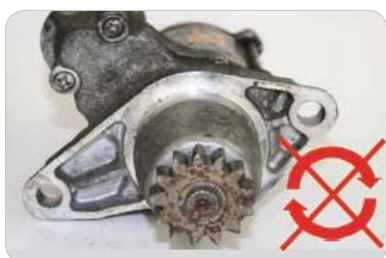
S hriadeľom sa nedá otáčať