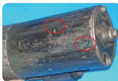
Nečitateľné číslo, chybajúci štítok